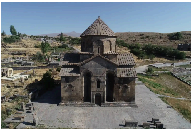
Սիսաւանի Սբ. Գրիգոր կաթողիկէն-յեփագային վերանորոն-ւած Սբ. Յովհաննէս Մկրտիչ-կառուցման ժամանակը կը համարուի 680-90ական տարիներուն՝ ըստ Ստեփան Մնացականեանի:

Վեցերորդ դարուն ապրող նշանավոր դէմքերէն եղած է Պետրոս Քերթող, որ աւանդութեան համաձայն աշակերտած է Մովսէս անուն Քերթողին: Ծննդեան ժամանակը յայտնի չէ, բայց Սիւնիքի եպիսկոպոս կը կարգուի շուրջ 549ին եւ տաս տարիներ առաջնորդութիւնը կը վարէ այս թեմին: Մասնակցած է Ներսէս Բ.